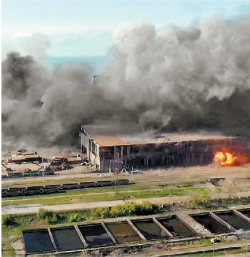
Fuego tras el ataque a la siderúrgica de Azovstal.